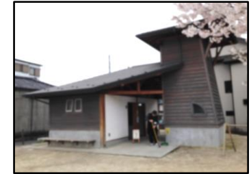
小町公園公衆トイレ清掃