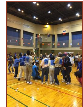
スポーツ大会参加