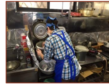
カレーハウスでの調理作業